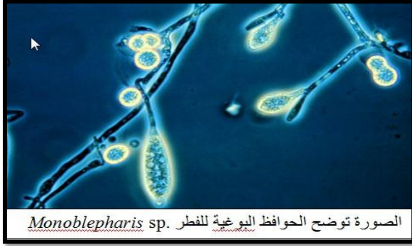
الصورة توضح الحواظ البوغية للفطر Monoblepharis sp.

فطريات صف Monoblepharidomyces مائية تعيش بصورة رمية على الاغصان والثمار في بيئة المياه العذبة ويمكن عزل هذه الفطريات من المياه عن طريق استخدام بذور القنب او السمسم كطعم . جسم الفطر بشكل ثالوس خيطي او غزل فطري يكون حوافظ بوغية طرفية ذات شكل دوري او اسطواني متطاوول شبيهه بالحواظ البوغية في الفطريات البيضية . ويكون التكاثر الجنسي في هذا الفطر من النوع البيضي .